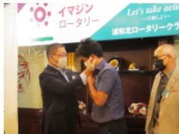
【2022.7.23 青少年交換委員会 主催地区セミナー】