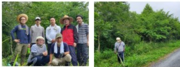
↓同年代？らしい3人です。